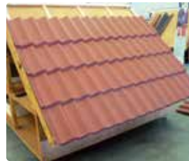
1 Bestaande situatie.