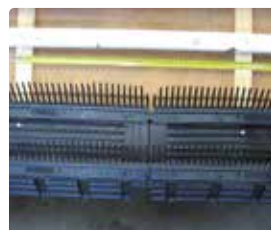
7 Controleer de afstand tussen de tengels ter plaatse van de koppeling van twee Vogelvide elementen. Is de afstand groter dan 500 mm, zorg dan voor extra ondersteuning onder deze koppeling.