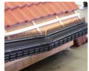
6 Koppel de tweede Vogelvide aan de eerste door de verbinding in elkaar te steken. Monteer vervolgens ook deze Vogelvide met RVS torxschroeven & neopreen-volgring op de tengels.