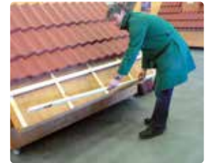
4 ...verwijder dit dan en verwijder de onderste panlat.