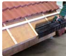
5 Begin aan de rechterzijde met het plaatsen van het eerste Vogelvide element. Breng de RVS torxschroeven & neopreen-volgring aan, door de Vogelvide in de tengels.