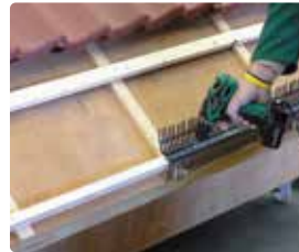
3 Is er vogelwering aanwezig, zoals een Vogelmuisschroot, Vogelschroot, een Kombi dakvoetprofiel of een ander profiel...