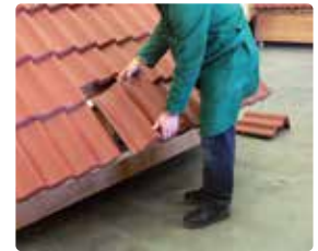
2 Schuif de tweede rij dakpannen omhoog en verwijder de onderste rij dakpannen over de gewenste breedte.