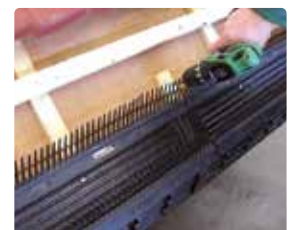
8 Ondersteuning voor de koppeling van twee Vogelvide elementen kan door een extra stukje tengel, van dezelfde dikte, aan te brengen.