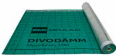
DivoDämm Membran 100 2S mit integrierter Doppelklebezone