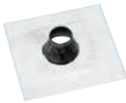
Divoroll Solar-Dichtmanschette 42–55 mm / 50–70 mm