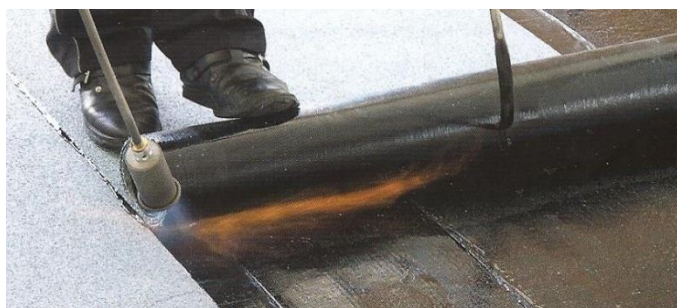
Natavování s navíječem rolí rozbalovačem rolí