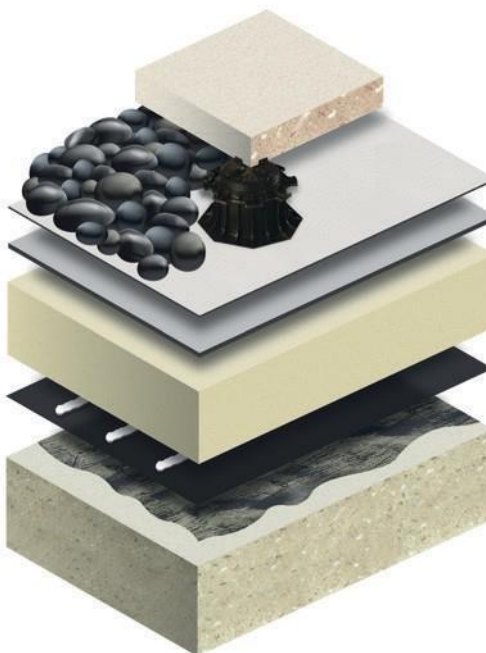
Sistema de Cubierta Caliente Lastrada

Edición 3, Marzo 2019. Esta información se facilita de buena fe y se basa en los conocimientos más recientes a los que BMI Group Management UK Limited ha tenido acceso. Aunque se ha hecho todo lo posible para garantizar que los contenidos publicados estén actualizados, se advierte a los clientes de que los productos, técnicas y códigos de prácticas están bajo revisión permanente y son susceptibles de cambio sin previo aviso. Se pueden producir cambios y no se da ninguna garantía respecto a la precisión de esta ficha técnica. El cliente deberá determinar él mismo si el producto se adapta al uso previsto. Esta ficha técnica solo es pertinente para la presente entrega. Las especificaciones de futuras entregas pueden ser distintas. Nuestras condiciones generales de venta, depositadas en la Cámara de Comercio del Reino Unido (o entidad local de BMI) con el núm. de expediente 09987127, se aplican a todas nuestras entregas.