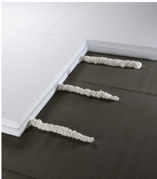
Klebstoff als Raupe auftragen, Dämmstoff einlegen, festdrücken – fertig.

Teroson EF TK 395 ist speziell für die Verklebung von Dämmstoffen im Flachdachbereich entwickelt worden.