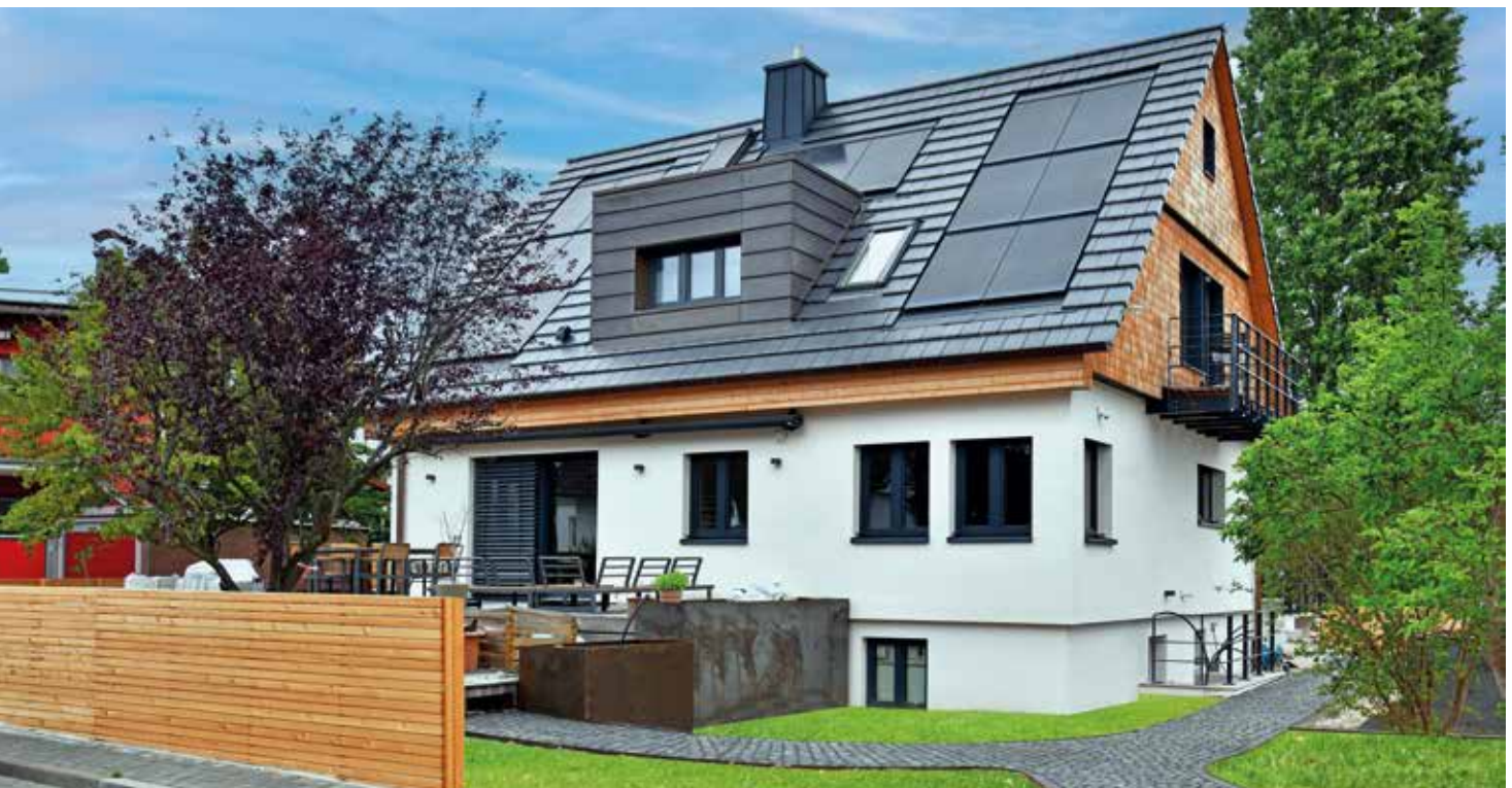
PV Indax: die leistungsstarke Lösung für jedes Dach.