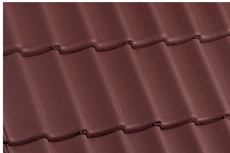
Bramac Donau Rotbraun