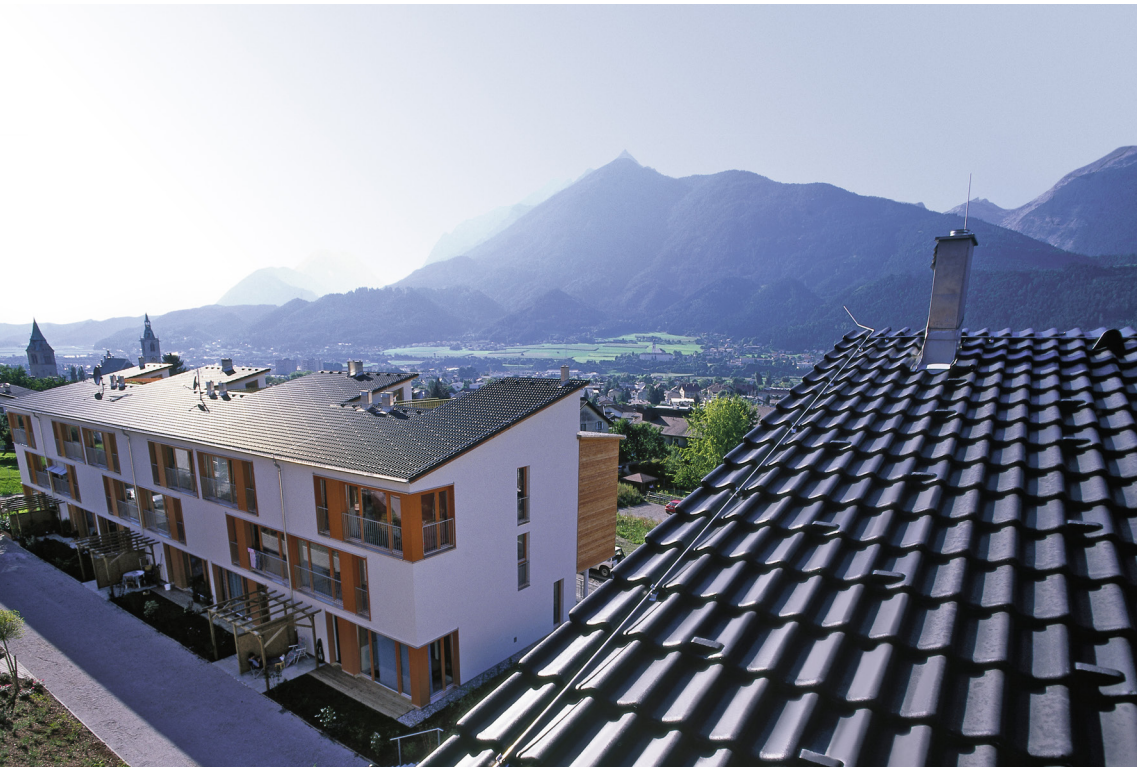
Bramac Donau Schiefer