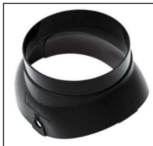
Nástavec pro odkouření turbokotle (Ø 116, 128 mm)