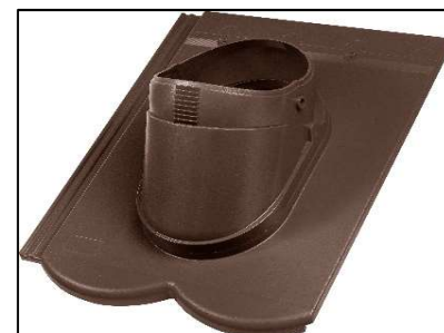
REVIVA Průchozí taška