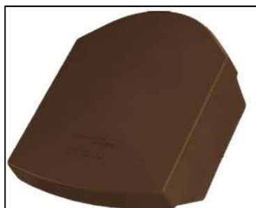
Kryt sanitárního nástavce DuroVent PLUS