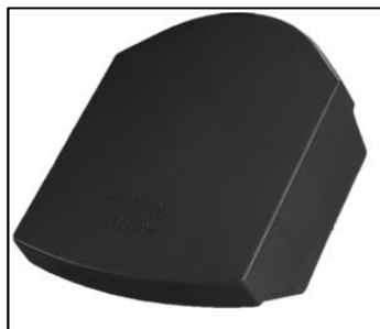
Kryt sanitárního nástavce DuroVent PLUS