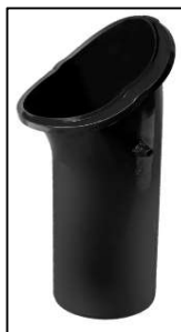
Napojovací trubka DuroVent PLUS