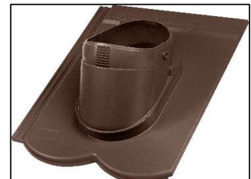
REVIVA Průchozí taška DuroVent PLUS