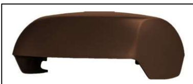
Kryt nástavce odvětrání kanalizace DuroVent PLUS