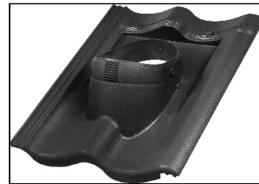
MT PP - Průchozí taška DuroVent PLUS