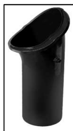
Napojovací trubka DuroVent PLUS