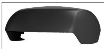
Kryt nástavce odvětrání kanalizace DuroVent PLUS

jednoduchá a rychlá montáž zajištění proti průniku dešťové vody univerzální produkt pro všechny modely betonových tašek Bramac