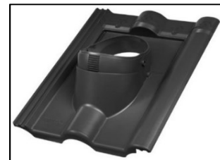
CLASSIC Průchozí taška DuroVent PLUS