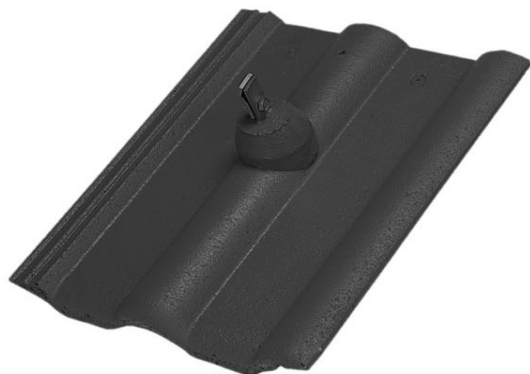
CL STAR, CL PP, CL, MO