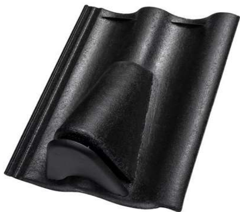
Odvětrávací taška s předsazeným krytem - Bramac MAX 7°