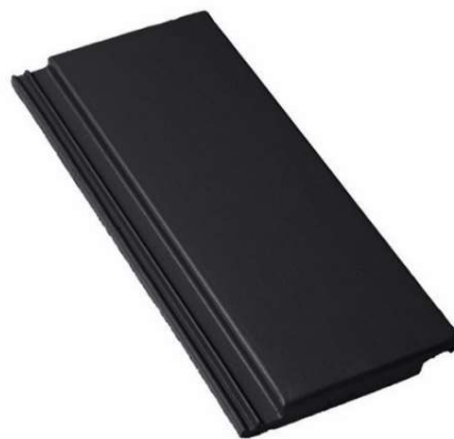
Tegalit STAR - ebenově černá