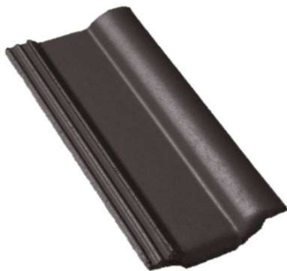
Classic STAR - ebenově černá