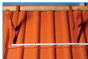
Obr. 2 - Max. rozteč držáků