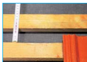
Obr. 1 - Poloha mezilatě pro montáž držáků

Důležité upozornění: Nad sněholamem musí být rozmístěny protisněhové tašky s hákem podle příslušného schéma v závislosti na sklonu střechy a charakteristické hodnotě s_k (dříve základní tíha sněhu s_0 ).