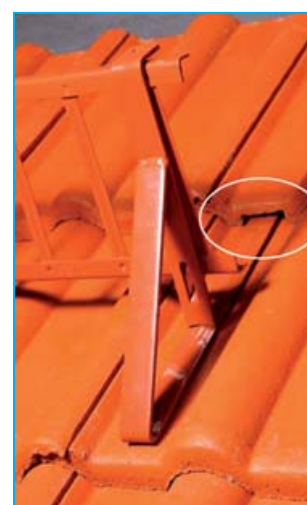
Obr. 3 - Vybroušená drážka