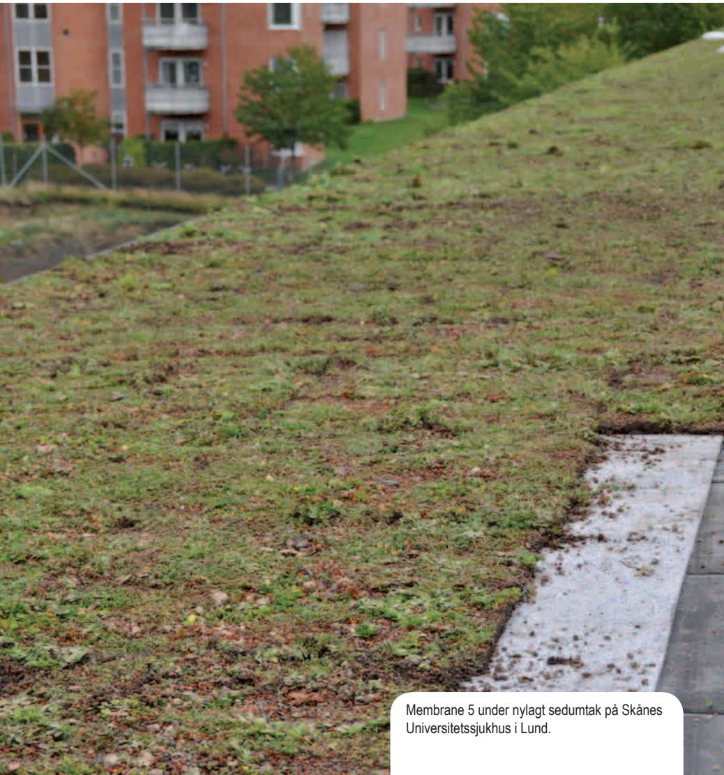
Membrane 5 under nylagt sedumtak på Skånes Universitetssjukhus i Lund.