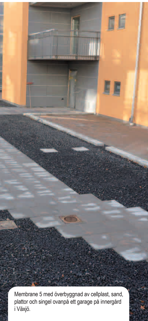
Membrane 5 med överbyggnad av cellplast, sand, plattor och singel ovanpå ett garage på innergård i Växjö.