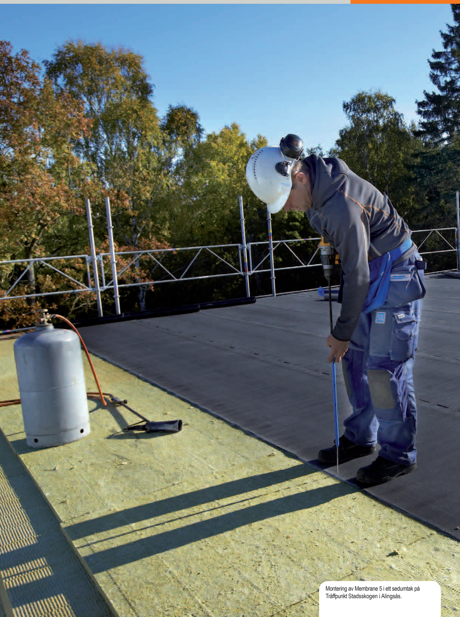
Montering av Membrane 5 i ett sedumtak på Träffpunkt Stadsskogen i Alingsås.