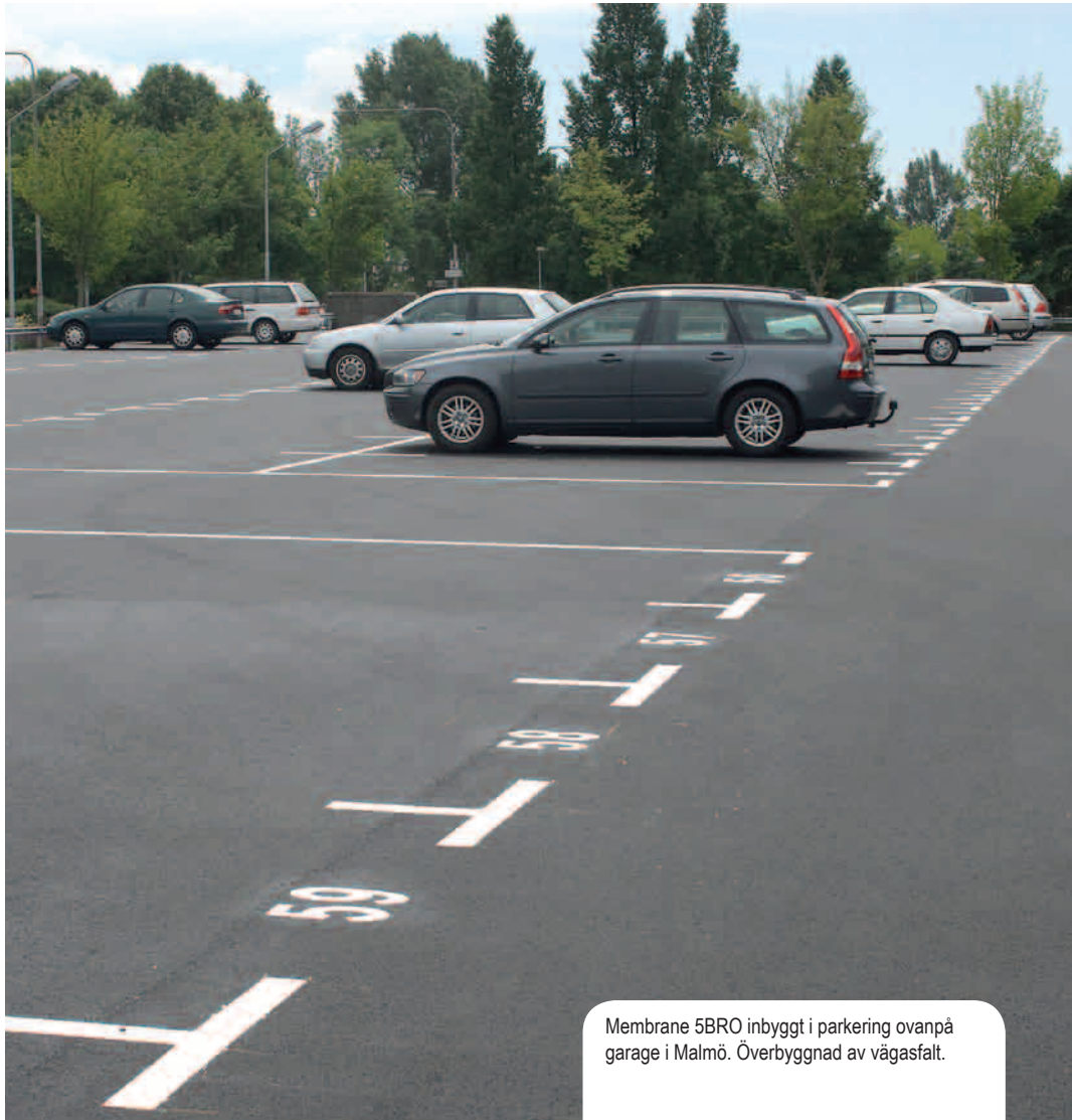
Membrane 5BRO inbyggt i parkering ovanpå garage i Malmö. Överbyggnad av vägasfalt.