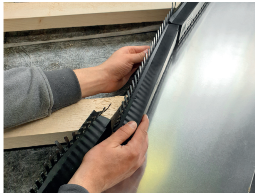
6 Det næstnederste element afkortes, så det kan samles over lægte med det nederste element.