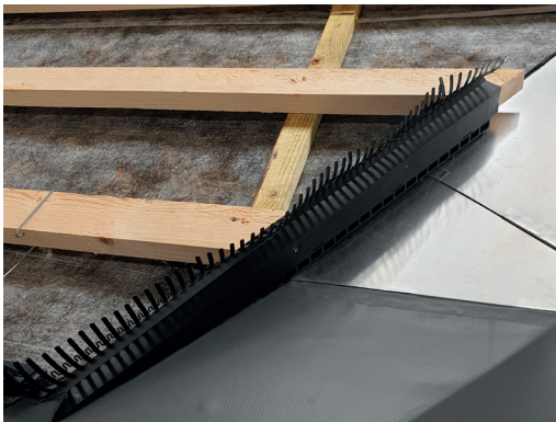
5 Det nederste element tilpasses i længden, så det passer til fuglegitter ved tagfoden. Hvis muligt afkortes elementet, så der kan laves en samling over næstsidste lægterække. Ved knæk i tagfoden skal det sidste element smigskæres i enden.