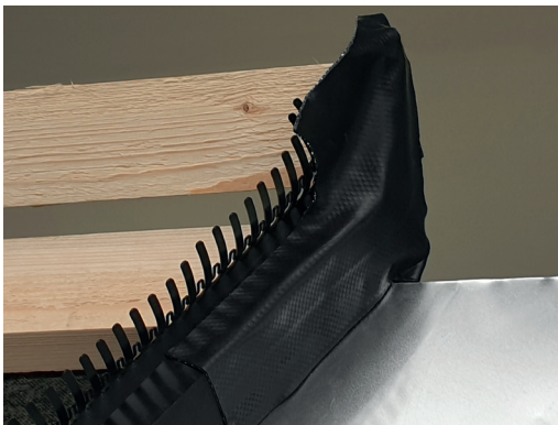
7 I situationer hvor to skotrendeelementer mødes i toppen, tættes åbning med et stykke tildannet Wakaflex.