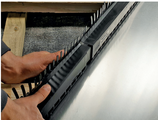
3 Elementerne skydes ind i hinanden.