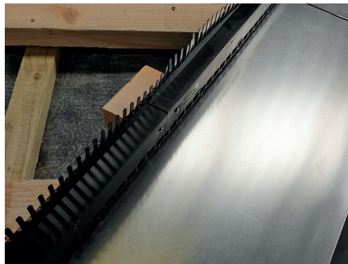
8 Ved større lægteafstande kan man med fordel montere en laske af et stykke taglægte i samlingen mellem to elementer, og begge elementer skrues fast i denne.