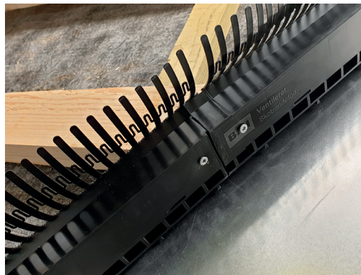
4 Ved samling over lægteender, fastskrues hvert element til lægten.