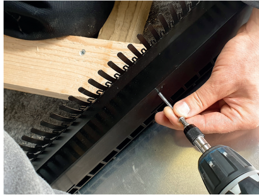
2 Elementerne fastskrues i lægteender.