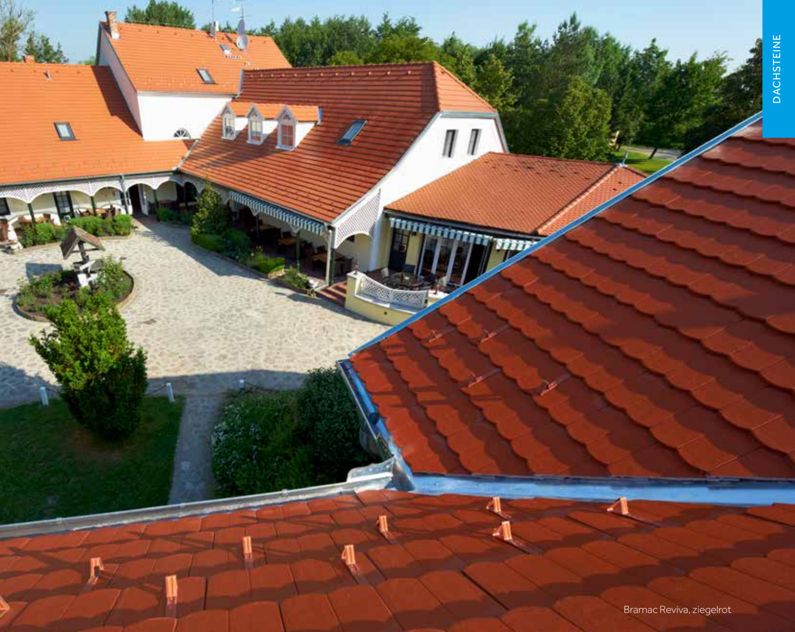
Bramac Reviva, ziegelrot