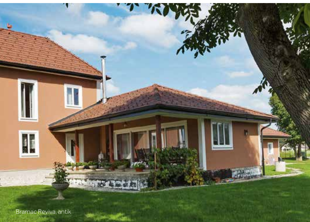
Bramac Reviva, antik

„Es freut uns, wenn Leute unser Haus bewundern. Viele sprechen uns auf das Dach an, weil es so stilvoll zum Haus passt. Von den vielen Materialien und Modellen, die wir uns angesehen haben, hat uns der Bramac Reviva am meisten angesprochen, da er traditionell und doch modern wirkt.“