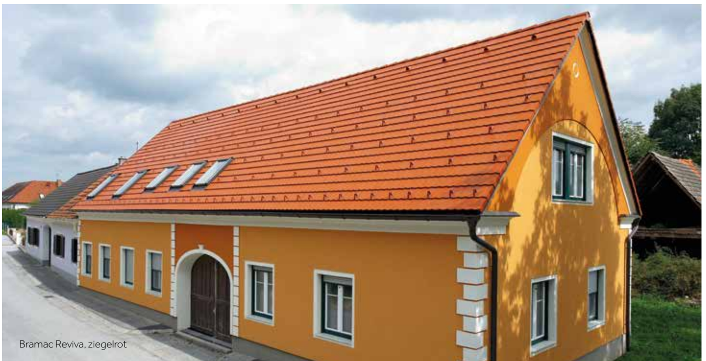
Bramac Reviva, ziegelrot