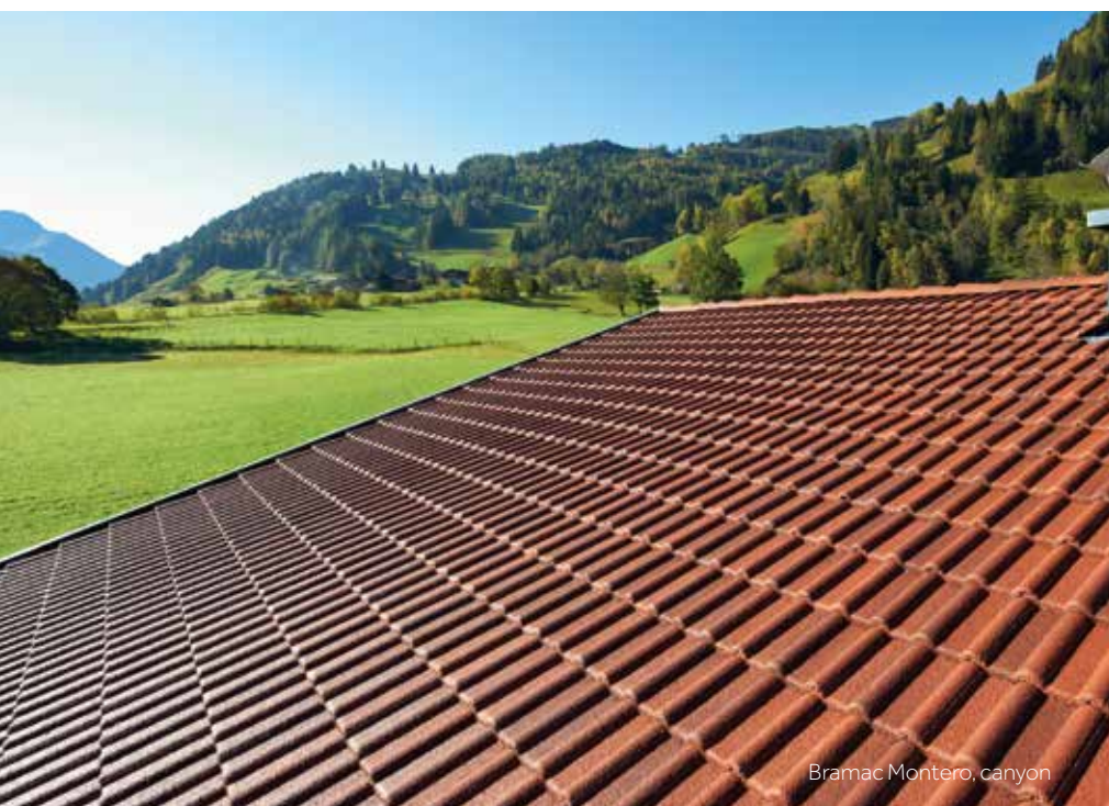
Bramac Montero, canyon

„ Wir leben hier abseits von Trubel und Hektik. Ein Ort zum Wohlfühlen. Das Wetter ist natürlich bei uns extremer und rauer. Da muss man sich auf ein Dach verlassen können, das auch höheren Beanspruchungen standhält. Aufgrund der Festigkeit des Bramac Montero brauche ich mir diesbezüglich keine Gedanken machen. Gott sei Dank!“