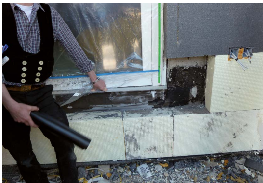
Nicht funktional: Abdichtungsversuch am Türanschluss mit einer Bitumendickbeschichtung. So bitte nicht.

Mit dem Ziel, nachhaltig und mit nachwachsenden Rohstoffen zu bauen, hält der Holzbau in den letzten Jahren immer mehr Einzug im Objektbau. Dies spiegelt sich in den teilweise neu strukturierten Landesbauordnungen wider, die den Holzbau auch in höheren Gebäudeklassen zulassen. Als organischer Werkstoff verzeiht Holz jedoch keine Fehler in Verbindung mit einer Dauerbelastung durch Wasser (rel. Luftfeuchte > 85 %). Schimmelbildung und holzerstörende Pilze sind die Folge. Ein guter Grund, um bei der Abdichtung der Balkonfläche auf Wolfin zu setzen. Als planerische Herausforderung zeigt sich immer wieder die Ausbildung der Anschlüsse im Detail, besonders bei Balkontüren. Die aktuellen Normen und Fachregeln weisen bei Neigungen bis 5° auf eine einzuhaltende Anschlusshöhe von mind. 15 cm ab Oberkante Belag hin, geben jedoch weiteren Spielraum und Vorgaben für die Unterschreitung dieser Anschlusshöhe. Die Oberkante Belag ist die letzte aufgebrauchte Schicht.